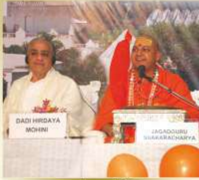
जगतगुरु शंकराचार्य जी के साथ