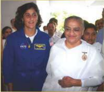
सुनीता विलियम्स के साथ