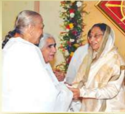
भारत के पूर्व राष्ट्रपति नहन प्रतिभा पाटिल जी के साथ