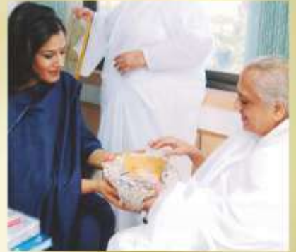
अभिनेत्री रवीना टंडन के साथ