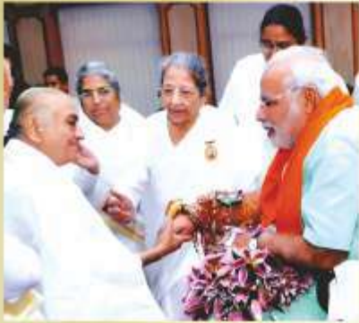
भारत के प्रधानमंत्री भ्राता नरेन्द्र मोदी जी के साथ