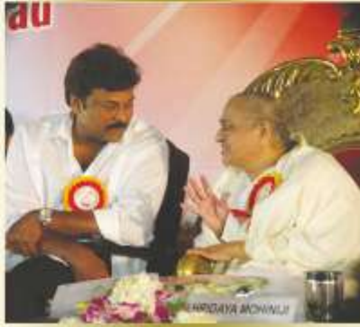
अभिनेता चिरंजिव के साथ