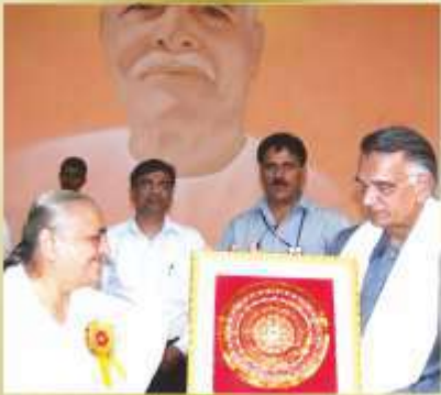
पूर्व गृहमंत्री भाता शिवराज पाटिल जी के साथ