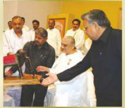
उत्तिसंगढ़ के पूर्व मुख्यमंत्री रमन सिंह जी के साथ