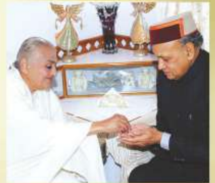
हि.प्र. के पूर्व मुख्यमंत्री भ्राता प्रेम सिंह धूमस जी के साथ