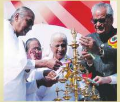
भारत के पूर्व उप-राष्ट्रपति भैरो सिंह शेखावत जी के साथ