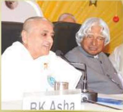
भारत के पूर्व राष्ट्रपति ए.पी.जे. अब्दुल कलाम जी के साथ