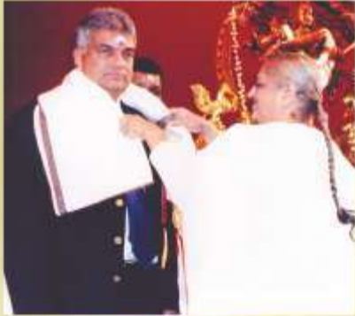
श्रीलंका के प्रधानमंत्री भ्राता रामिल विक्रमसिंघे जी के साथ