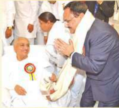
भारत के राष्ट्रीय अध्यक्ष भ्राता जगत प्रकाश नड्डा जी के साथ