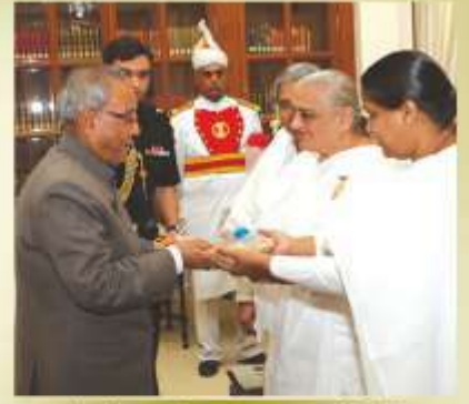
भारत के पूर्व राष्ट्रपति भ्राता म्णब मुखर्जी जी के साथ