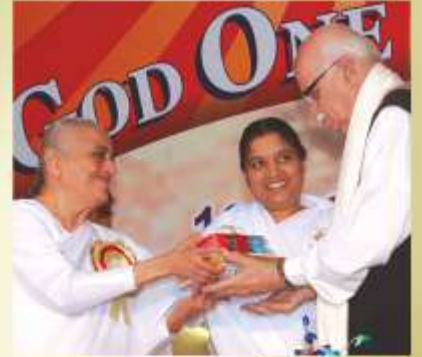
भ्राता लालकृष्ण आडवाणी जी के साथ