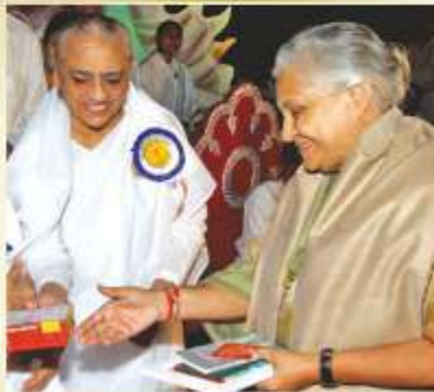
दिल्ली की पूर्व मुख्यमंत्री बहन शीला दीक्षित जी के साथ