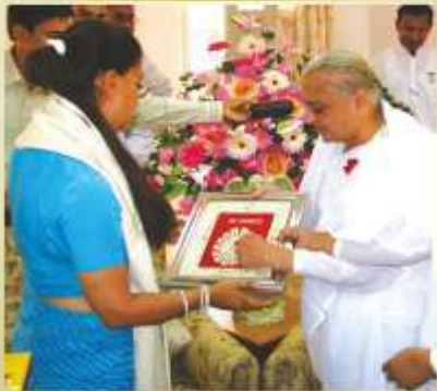
राजस्थान की पूर्व मुख्यमंत्री बहन वसुन्धरा राजे सिंधिया जी के साथ