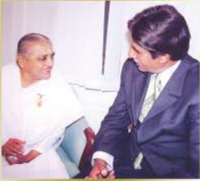
अभिनेता अमिताभ बच्चन जी के साथ