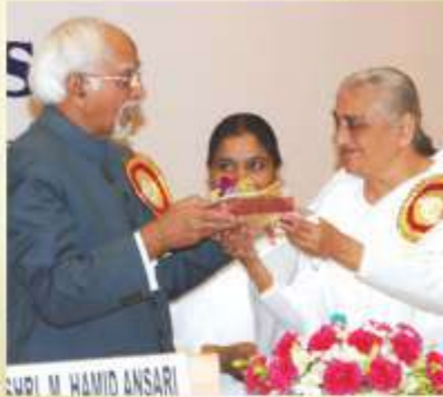
भारत के पूर्व उप-राष्ट्रपति भ्राता हामिद अंसारी जी के साथ