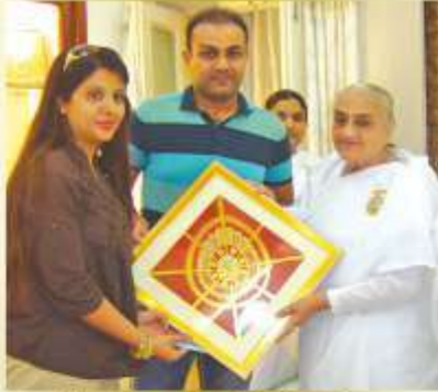
वीरेंद्र सहवाग एवं उनकी मर्भपत्नि के साथ