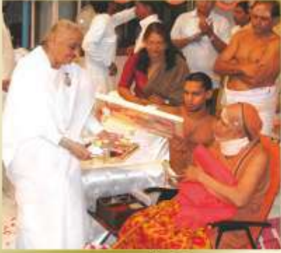
जगतगुरु शंकराचार्य जी के साथ